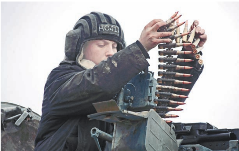
Заряжание пулемёта НСВТ.