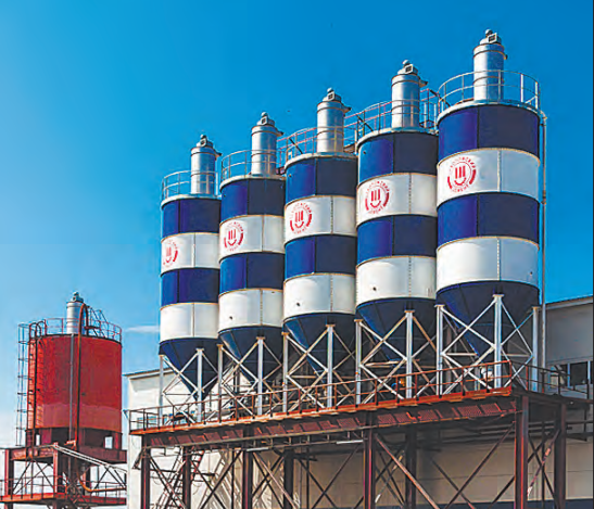
Участок сухих смесей производительностью 100 000 тонн в год.

Производство ООО «Староцементный завод» по технологии, при непрерывном контроле качества и сопровождении ООО «СКС-Сибирь».