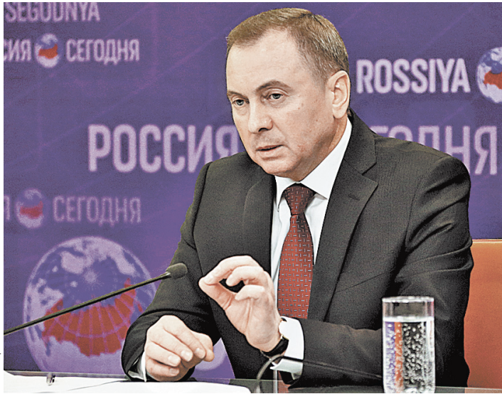
Владимир Макей: Главное завоевание в Союзном государстве — это то, что мы создали равные права для наших граждан.

— Да, иногда возникают определенные проблемы, но это вполне естественно. Как говорят, «милые бранятся — только тешатся». Даже в отношениях между близкими возникают какие-то трения, недоумки. Но самое главное — это нацеленность на то, чтобы не забыть то позитивное, что идет еще из глубины прошлых веков. А его у нас очень и очень много.