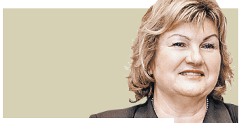
Лилия Ананич, министр информации Беларуси:

В МОГИЛЕВСКОМ Белорусско-Российском университете прошел девятый открытый республиканский фестиваль творчества иностранных студентов «Дружба народов». В конкурсной программе выступили студенты из Минска, Могилева, Витебска, Гомеля и Гоморок. На форуме в Могилеве побывали и представители российских вузов.