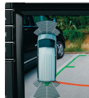
Камера заднего вида