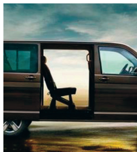
Электропривод правой сдвижной двери