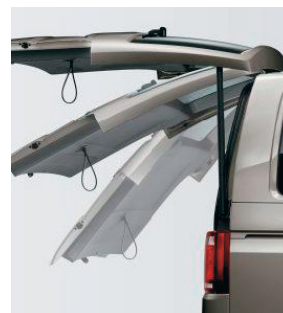
Электропривод задней двери