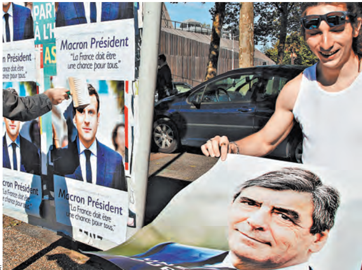
Макрон, Фийон и Ле Пен подошли к финишу с близкими рейтингами.

жилась парадоксальная. Явного лидера в президентской гонке нет. Хотя до недавнего времени, казалось, что на эту роль претендуют то харизматичная глава Национального фронта Марин Ле Пен, то основатель внепартийного движения «На марше» Эммануэль Макрон, собравший вокруг себя реформистских перебежчиков из лагеря Соцпартии, часть центристов, а также всех, кому импонируют его фотогеничный профиль и гладкие речи о радужных перспективах, ждущих страну при его гипотетическом правлении. Но отныне вровень с ними идут и Франсуа Фийон, и левый выдвиженец «Неподчинившейся Франции» Жан-Люк Меланшон.