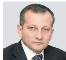
ИСАЕВ Эли Абубакарович , заместитель руководителя Казначейства России