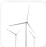
Технологии энергоэффективности и энергосбережения