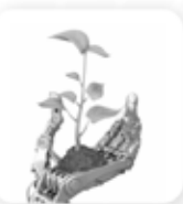
Инновации в экологии