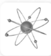
Медицина, фармацевтика, биотехнологии, химия