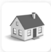
Строительные технологии и строительные материалы