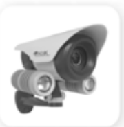
Технологии безопасности жизнедеятельности