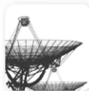
Космос и связь