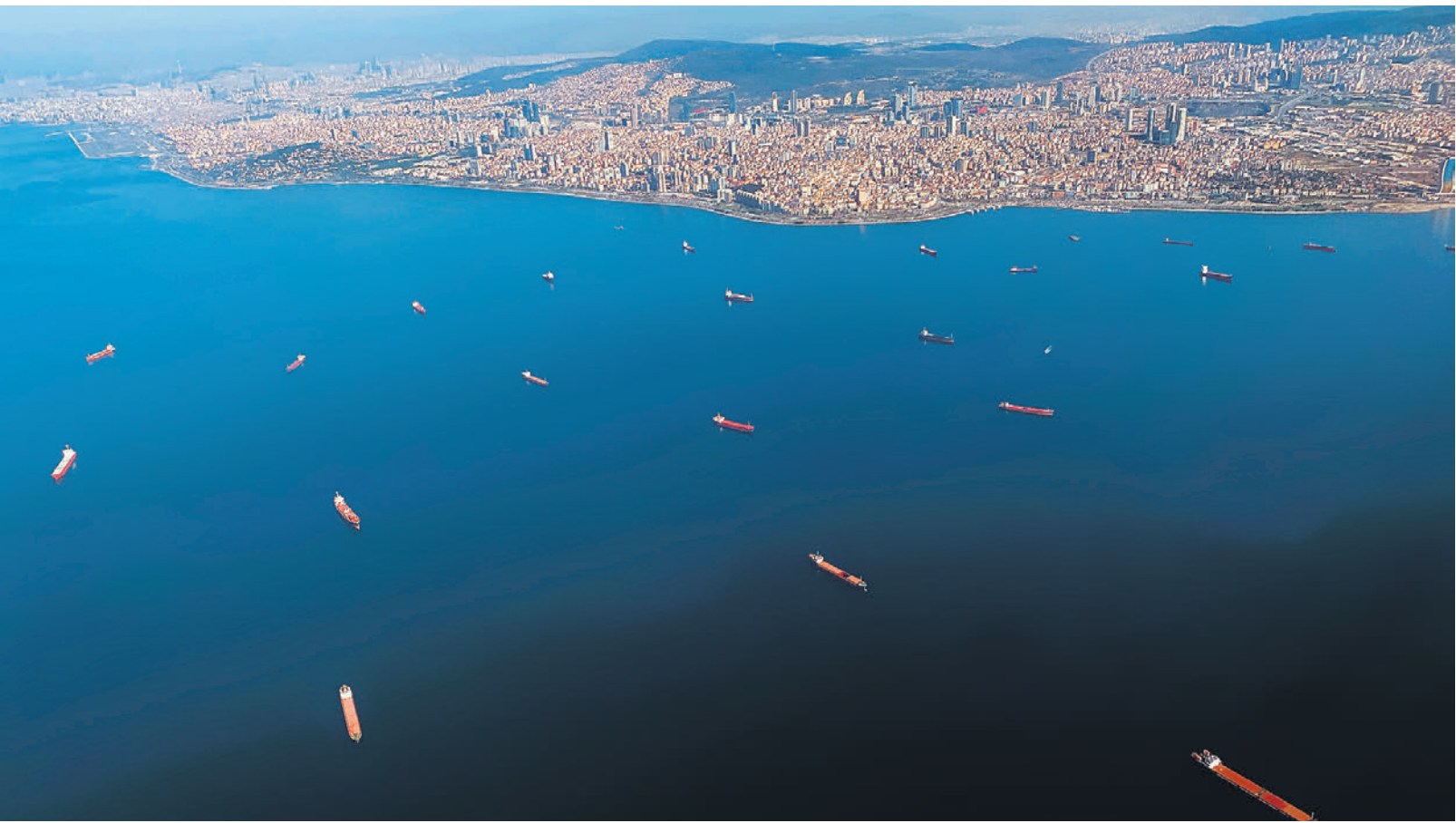
Турция, которой весьма выгоден проход судов по Босфору (на фото), ратует за продление зерновой сделки с учетом требований России

Напомним, Москва по-прежнему полагает, что рос-