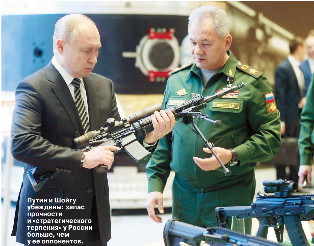
Путин и Шойгу убеждены: запас прочности и «стратегического терпения» у России больше, чем у ее оппонентов.

Эксперт Андрей Сушенцов: «Вся история России говорит о том, что наиболее результативными наши действия оказывались тогда, когда мы навязывали противнику затяжное противостояние»