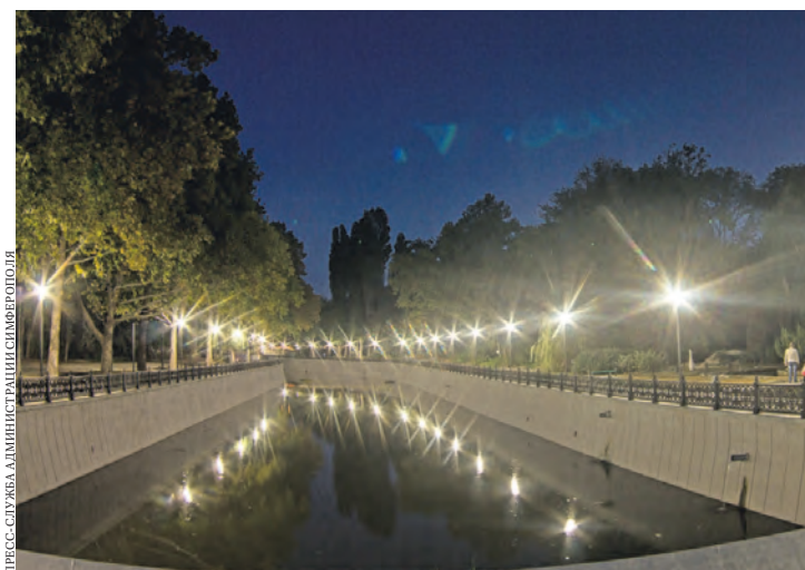
Ежедневно рабочие устанавливают и подключают 35 фонарей.