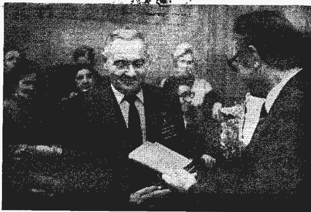
Ветеранам вручали памятные подарки и сувениры.

Уйдя на заслуженный отдых, ветераны по мере своих сил и возможностей продолжают трудиться, передавая молодому поколению накопленные знания и опыт.