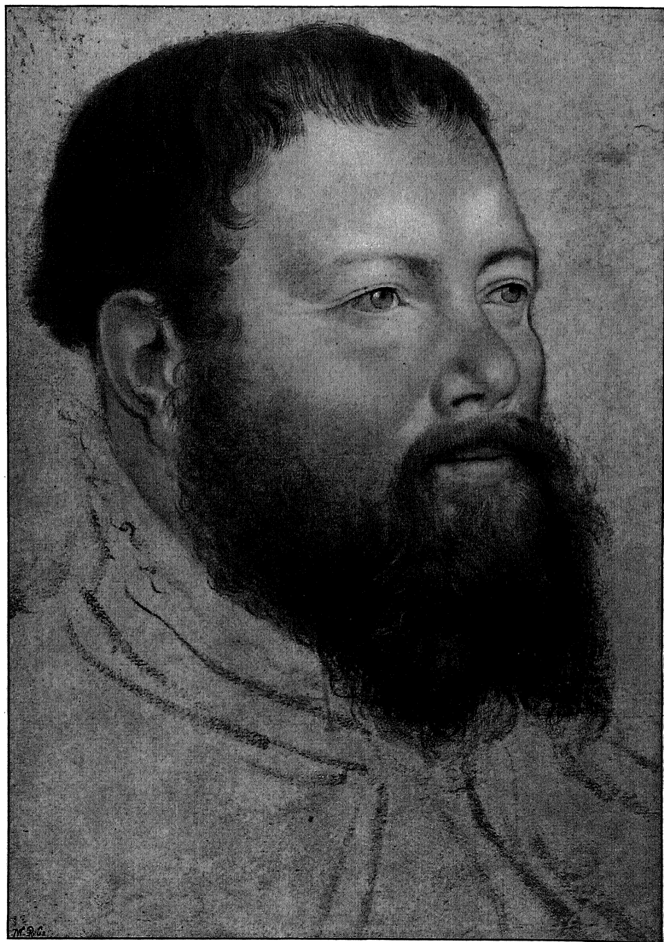
Bildnis eines Unbekannten. Deckfarbenmalerei. Im Königl. Kupferstichkabinett zu Berlin. (Zu Seite 102.)