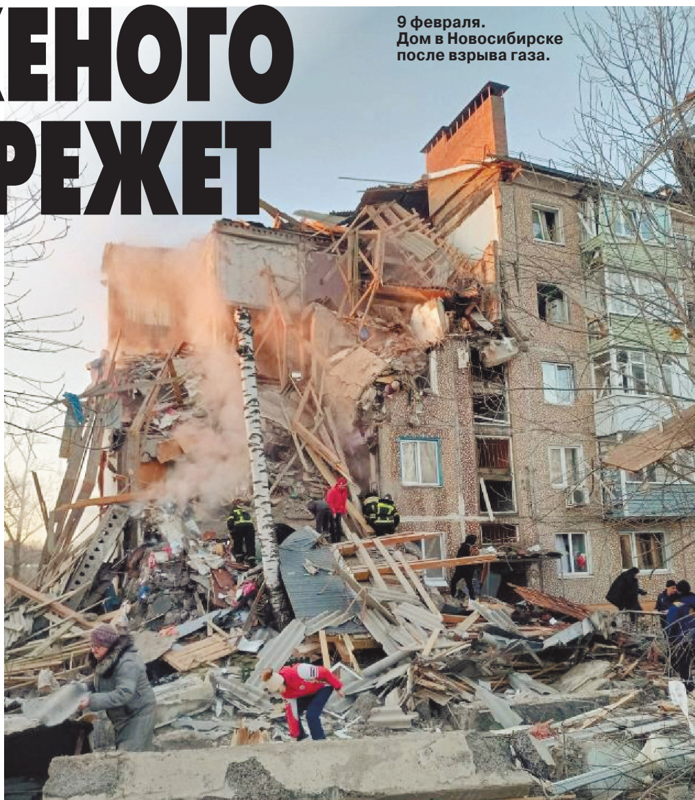
9 февраля. Дом в Новосибирске после взрыва газа.