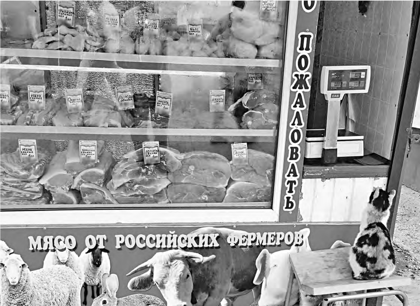
Фото из архива: о таких ценах на мясо и кошке приходится только мечтать.