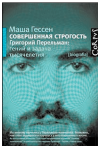
Гессен М. Совершенная строгость. Григорий Перельман: Гений и задача тысячелетия / Пер. с англ. И.Кригера.

4 Журналист и писатель Маша Гессен помогает разобраться в феномене Григория Перельмана — российского математика, доказавшего гипотезу Пуанкаре, одну из семи «задач тысячелетия», за решение каждой из которых американский Институт Клэя установил премию в миллион долларов.