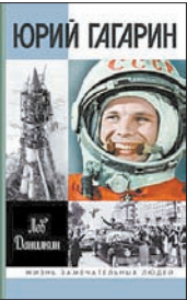
Данилкин Л. Юрий Гагарин. М.: Молодая гвардия, 2011. — 512 с.: ил. — (Жизнь замечательных людей). 20 000 экз. (п) ISBN 978-5-235-03440-2

Есть такое специальное хулиганство, праздничное. Даже не хулиганство, а санитарно необходимый перформанс по отковыриванию от обожаемого монумента всего, чем добрые люди его успели обмазать и инкрустировать. Так, почти всегда обнаруживаются какие-то совсем забытые замечательные черты и очертания дорогого именинника, ради которых, собственно, и стоит праздновать. Вот и Лев Данилкин «отскребает» Первого Человека в Космосе. Отскребает от биоматериала — чуть более крупной, чем раньше, собачки, сунутой в летательный аппарат; от харизматичного простачка, выезжавшего на синих глазах и космической улыбке; от