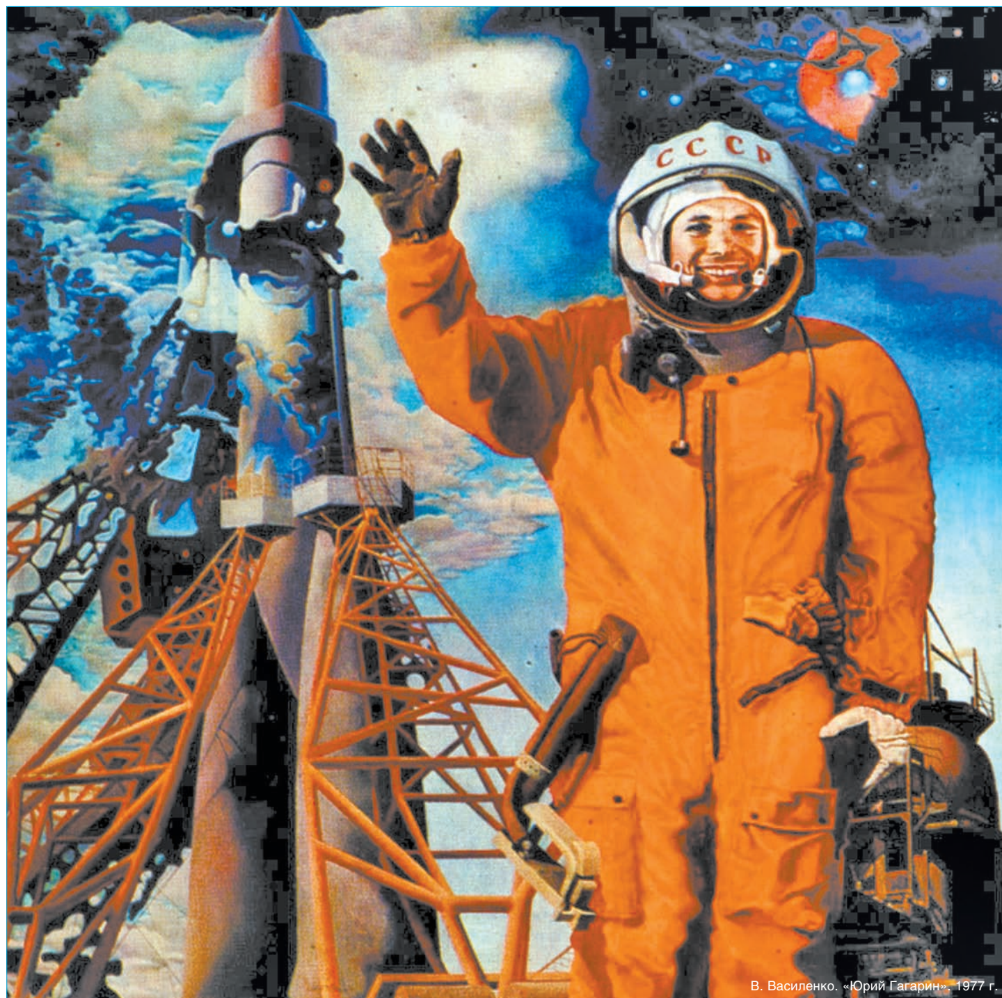
В. Василенко. «Юрий Гагарин». 1977 г.