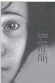
Селзник Б. Хранитель времени / Пер. с англ. С. Чулковой.

6 Не нужно представлять, что вы попали в кинотеатр и смотрите, как на большом мерцающем экране пробегают кадры довоенного Парижа, а мальчишкоборвш заходит в старинное здание вокзала и находит механического человечка из коллекции некоего Жоржа Мельеса. Потому что до вас это уже сделал Брайан Селзник.