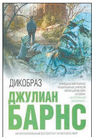
Барнс Дж. Дикообраз / Пер. с англ. Е.Храмова.

5 Раньше издававшийся лишь в журнальной публикации, «Дикообраз» мэтра современной британской прозы Джулиана Барнса впервые выходит книгой. На этот раз постмодернист туманного Альбиона играет с послевоенной Восточной Европой, где рушится коммунизм — и надо что-то делать со свергнутым диктатором.