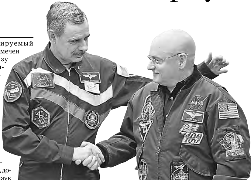
Михаил Корниенко и Скотт Келли будут жить и работать в невесомости целый год.