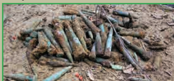
Польские солдаты собирают найденные в земле патроны