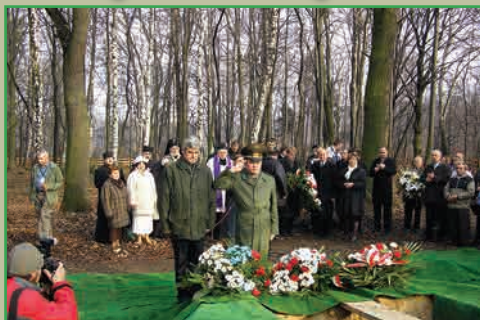
Россия не забыла. Русские дипломаты из посольства в Варшаве отдают честь россиянам – солдатам, павшим 94 года назад