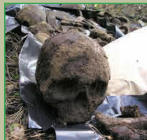
Останки русских солдат, предположительно из 22-й дивизии, которая сражалась в районе деревни Домброва 16-21 ноября 1914 года