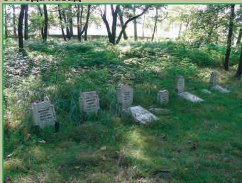
К сожалению, есть ещё заброшенные кладбища