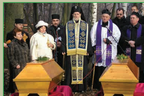
Павших воинов перезахоронили с соблюдением ритуалов основных религиозных конфессий