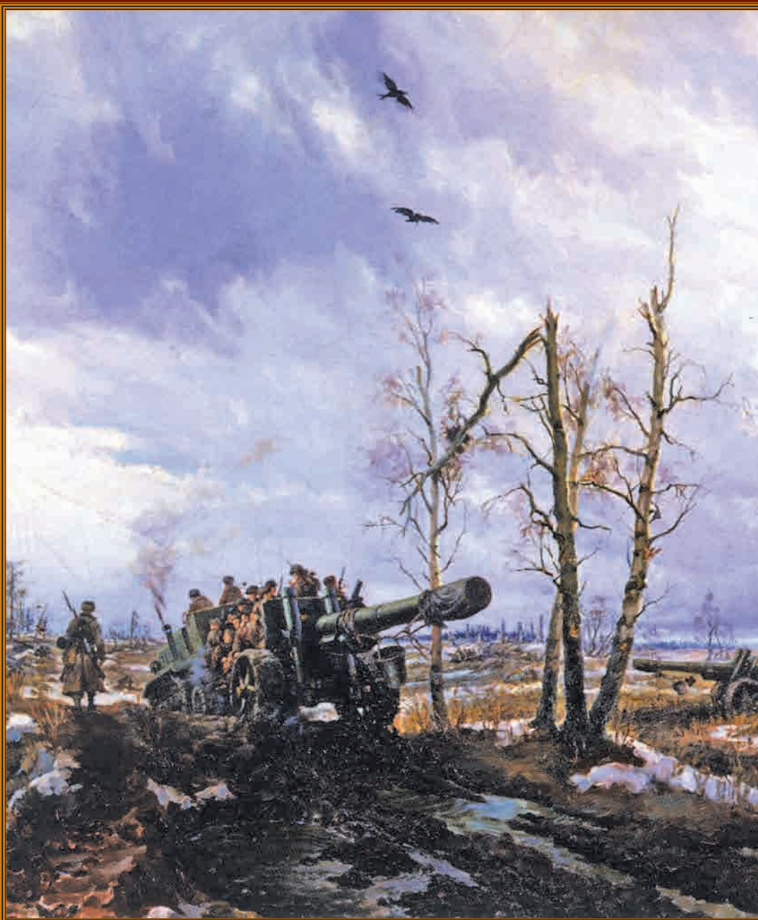
Освобождённая земля Смоленщины Художник В.Е. Памфилов

19 ноября – День ракетных войск и артиллерии