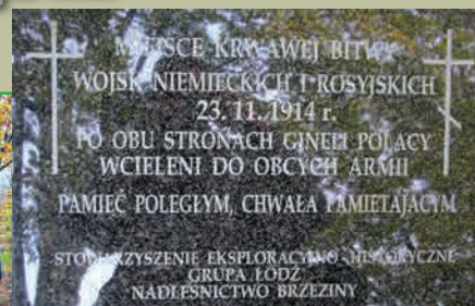
Группа энтузиастов открывает памятник русским солдатам на месте их гибели – в лесу у деревни Галгиф