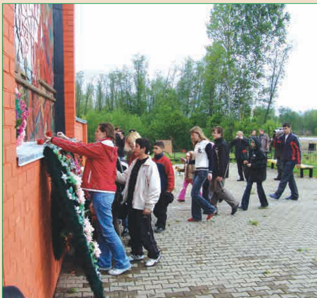
Возложение школьниками венков к памятнику воинам 2-й ударной армии