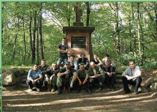
Члены исторического общества «Группа Лодзь»