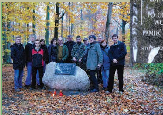
Крест в Галковом лесу, обложенный камнями