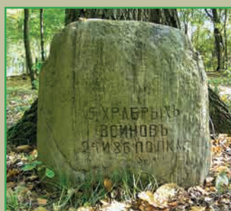
Памятник павшим русским солдатам, отреставрированный в 2007 году