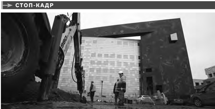
Государственный Эрмитаж завершает строительство третьей очереди нового фондохранилища, которое находится в Старой Деревне. Проект реализуется с 2000-х годов, сейчас возводится здание инженерно-лабораторного корпуса и библиотеки. Здесь разместятся восемь реставрационных лабораторий, научно-исследовательский центр и уникальный комплекс для влажной чистки старинных ковров и шпалер — первый в России.