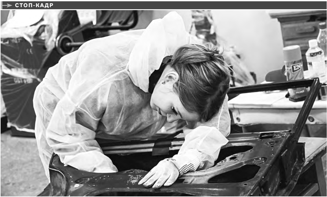
В Карелии стартовала неделя профессионального мастерства студентов колледжей и техникумов, а также мастеров производственного обучения. Свои умения демонстрируют будущие повара, токари, водители автомобилей и автослесари (на фото), специалисты в области информационных технологий.

В ЯНВАРЕ и феврале плата за общедомовые нужды выросла для псковичей в 30 раз, например, за электричество по ОДН пришлось платить 600 рублей вместо 20. Почти сразу руководство региона заявило о том, что в расчеты «закралась ошибка». Сейчас скандальный приказ по переходу на новый метод исчисления отменен, УК поручено произвести перерасчет по уровню декабря 2016 года. Изменения должны отразиться в квитанциях жителей до конца марта.