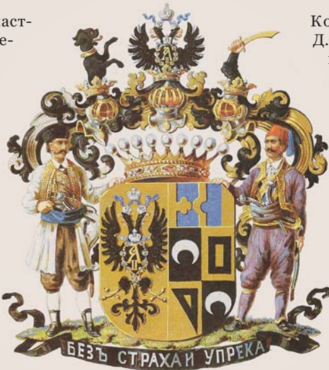
Герб графа М.А. Милорадовича

При переходе русских войск на старую Калужскую дорогу арьергард Милорадовича своими энергичными ударами по противнику, неожиданными и хитроумными перемещениями обеспечил скрытное проведение этого стратегического манёвра. В горячих боях и стычках он не раз заставлял отступать рвавшиеся вперёд французские части.