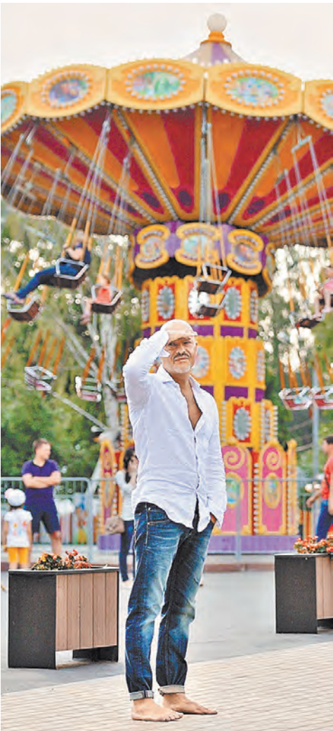
На экраны фильм «Призрак» с Федором Бондарчуком в главной роли выйдет во второй половине 2015 года.

Персонаж Федора Бондарчука—сильный, властный, эгоистичный человек, который привык все держать под контролем и не считаться с чужим мнением. Поставленный в новые обстоятельства, когда от него по сути ничего не зависит, Гордеев вынужден пересмотреть свое отношение к жизни и научиться доверять другим. —Я не суеверный человек, а верующий,— рассказал «РГ» Федор Сергеевич.—И вообще-то не люблю страшные истории про потусторонние силы, такие страшилки из пионерлагеря. Но здесь совсем другая история. Вообще призраков в кинематографе как полноценных героев фильмов не так уж и много. Можно вспомнить только «Привидение» с Патриком Суэйзи и «Шестое чувство» с Брюсом Уиллисом. В нашем фильме сразу становится ясно, что герой—привидение, никакой интриги или загадки нет.