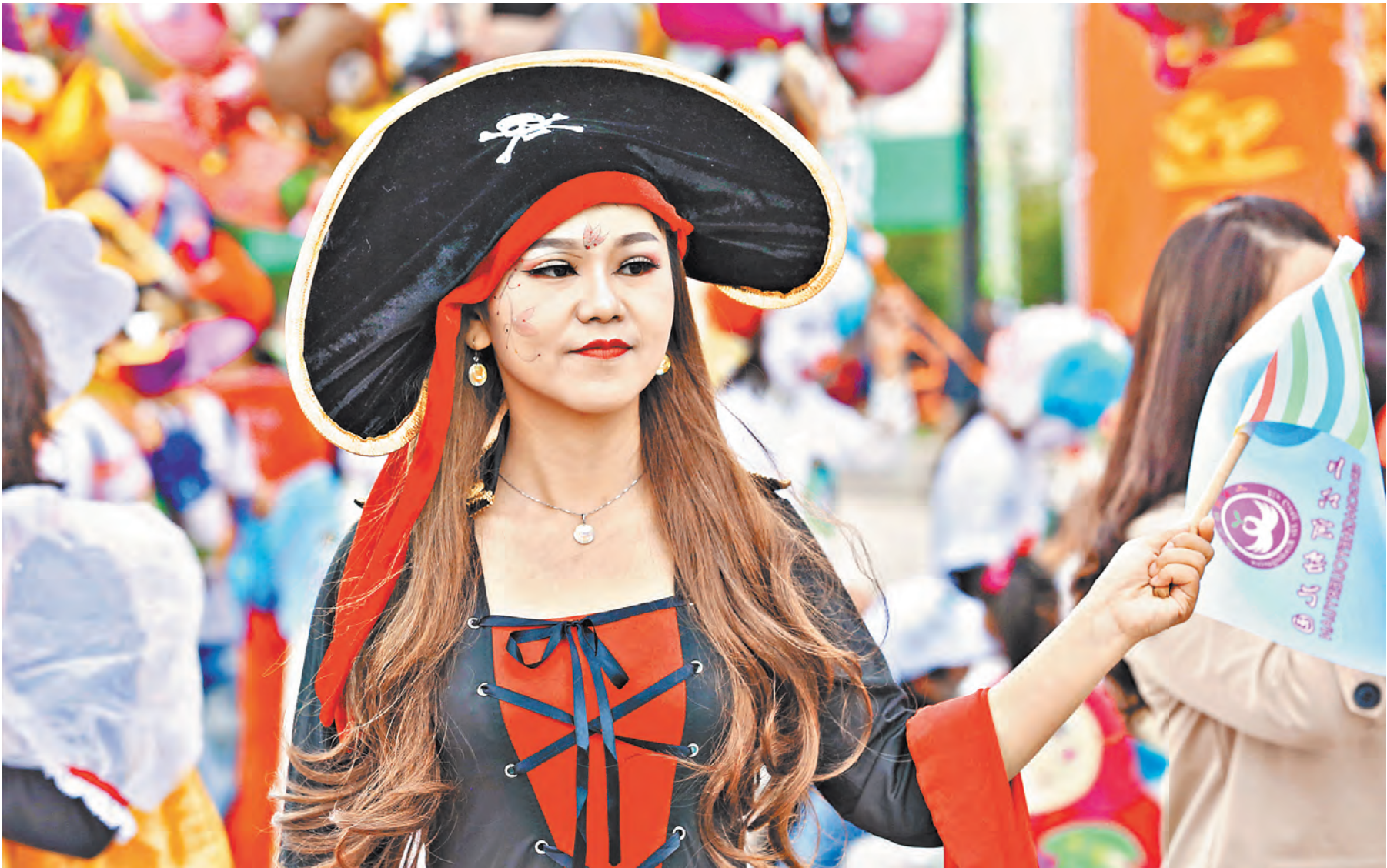
Участница парада по случаю Дня защиты детей в городе Хэйхэ, расположенном на границе между Китаем и Россией в провинции Хэйлунцзян, одетая в костюм, сделанный своими руками. На празднование собрались около 10 тысяч детей, их родителей и учителей из Китая и России. В последние годы по мере расширения сферы торгового-экономического сотрудничества и культурных контактов между Хэйхэ и регионами России все больше россиян выбирали Хэйхэ для постоянного места жительства.

Заместитель министра иностранных дел России Сергей Рябков заявил: он уверен в том, что саммит в Сямэне станет огромным успехом, который укрепит сотрудничество и взаимодействие всех членов БРИКС.