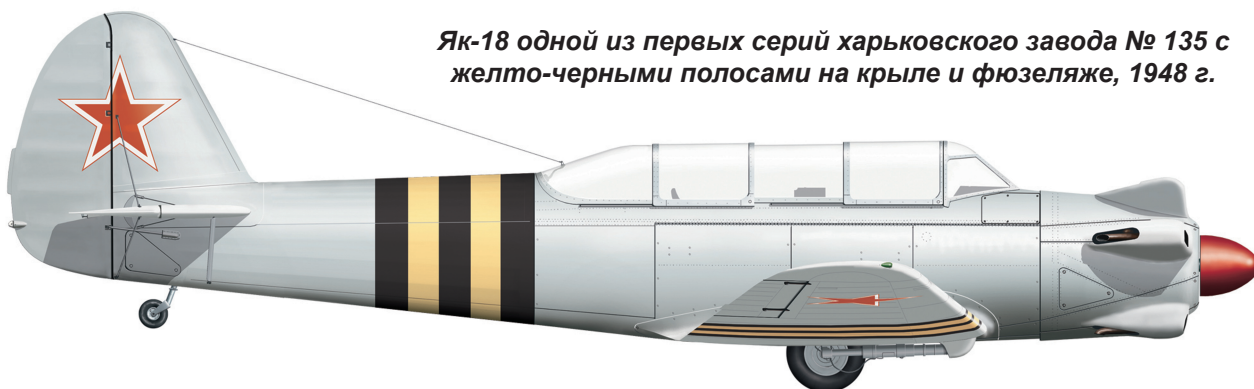
Як-18 одной из первых серий харьковского завода № 135 с желто-черными полосами на крыле и фюзеляже, 1948 г.