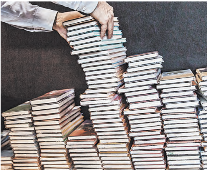
В книжном форуме приняли участие экспоненты из 29 стран мира.

В книгоиздательском деле у белорусов и россиян много общего. Потому с интересом прошли «круглые столы», посвященные развитию книжной отрасли России и стран СНГ, и семинар «Информационные электронные ресурсы и сервисы для науки и образования: новый формат российско-белорусского сотрудничества».