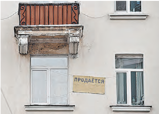
ДОМАТ СОЮЗНИН / ГЛАС

ЗАКОН / Какой налог надо заплатить россиянину от продажи квартиры в Беларуси? / Страница 4