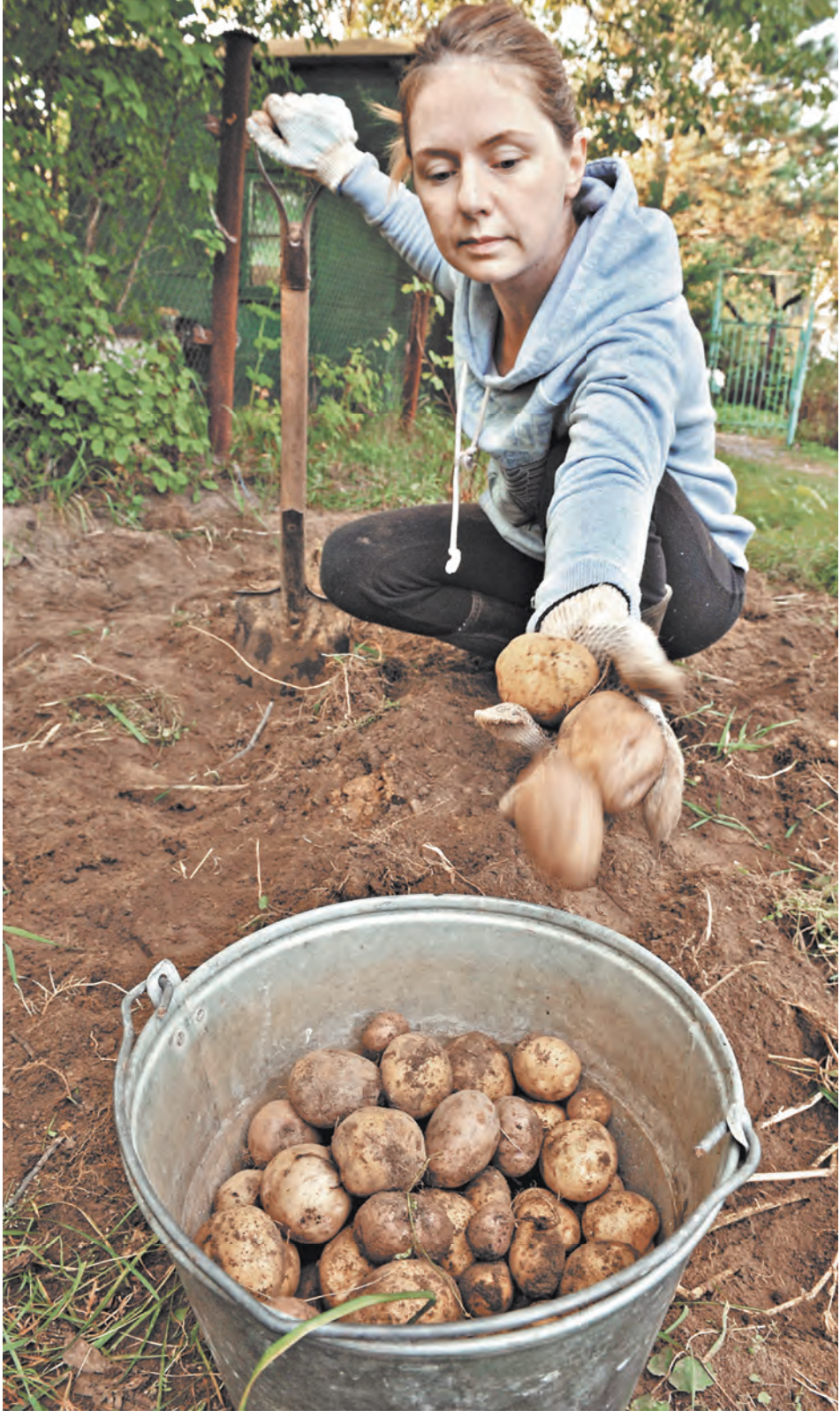
Программа по картофелю и топинамбуру напрямую связана с продовольственной безопасностью.

— Потому что наш университет — не только учебное заведение, где обучаются сегодня 20 тысяч студентов, аспирантов и докторантов.