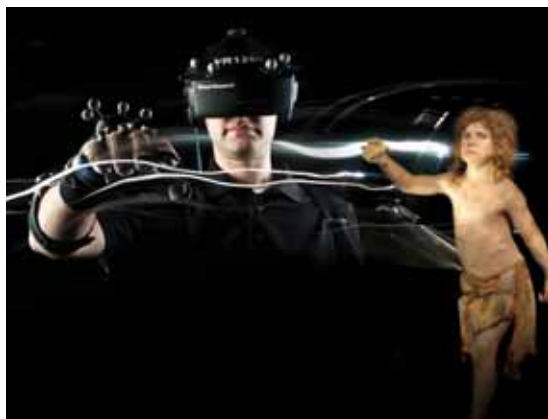
А. ГОЛОВНЕВ Антропология движения: историческая методология и гуманитарная технология