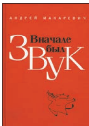
Макаревич А. Вначале был звук: Маленькие ИСТОРИИ М.: Эксмо, 2010. — 256 с.

6 Грамотно употреблять еду и горячительные напитки под авторитетным руководством Андрея Макаревича мы уже научились. А «Вначале был звук» дает прекрасную возможность поизучать в его приятной компании нотную грамоту, интересные особенности музыкальных инструментов... да и просто лишний раз проникнуться величием Битлов.