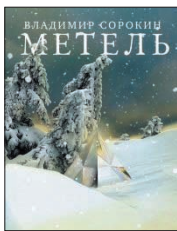
Сорокин В. Метель. М.: АСТ, Астрель, Харвест, 2010. — 304 с.