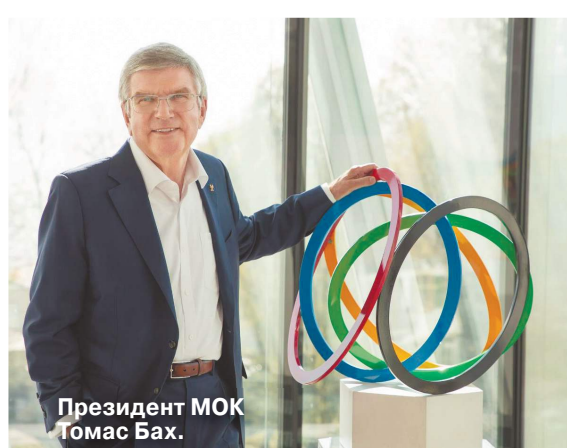
Президент МОК Томас Бах.