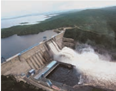
Вид на Бурейскую ГЭС.

Что удивительно: специалисты «РусГидро» не только не дождались доброго слова в свой адрес, но, наоборот, услышали обвинения в том, что вода прошла через плотины Зейской и Бурейской ГЭС. Некоторые блогеры до сих пор пытаются предъявлять гидроэнергетикам претензии в бездействии. Хотя на самом деле без плотин ГЭС паводок обрушился бы на местные города и поселки на полмесяца раньше, а уровень воды был бы почти вдвое выше. Так что жителям прибрежных территорий за свое спасение надо благодарить советских строителей, заложивших гидроэлектростанции на Зее и Буре, и их потомков, которые сумели своими умелыми действиями остановить стихийное бедствие. По оценке