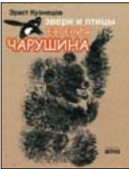
Кузнецов Э. Звери и птицы Евгения Чарушина. М.: Издательство Детской литературы, 2012. — 192 с.: ил.

2 Первое издание «Зверей и птиц Евгения Чарушина» вышло в 1983 году. Самое время перечитать историю о жизненном пути чудесного художника-анималиста и выдающегося писателя — человека, чьи птицы и звери были верными и веселыми спутниками нашего детства и многим из нас преподали самый первый урок понимания природы.