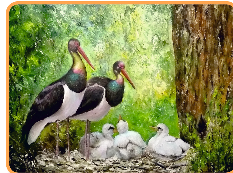
Николаева Наталья. «Черный аист», 2017, холст, масло, 50х70