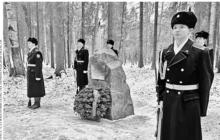
ПРЕСС-СЛУЖБА ПРАВИТЕЛЬСТВА ЛЕНИНГРАДСКОЙ ОБЛАСТИ

В Гатчине сегодня завершает работу Международный научно-практический форум «Без срока давности», посвященный 77-летию с момента начала Нюрнбергского процесса. В течение трех дней его участники говорили не только о преступлениях против человечности, совершенных в годы Великой Отечественной войны, но и об опасностях современного неонацизма. В рамках форума в гатчинском парке «Сильвия» открыли мемориальный камень в память о мирных жителях и военнопленных, массовое захоронение которых было найдено на этом месте.