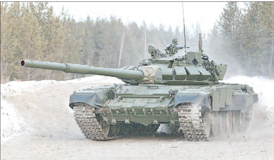
Подготовил Владислав БЕЛОГРУД.

Всего в учении было задействовано около 200 военнослужащих, а также более 20 единиц военной и специальной техники.