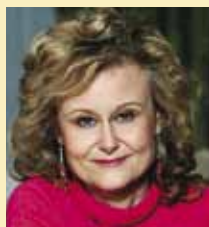
7 июня Агриппину Аркадьевну – Дарью Донцову, автора