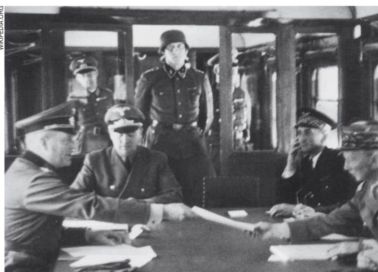
Во время Второй мировой войны Франция продержалась под ударами немцев шесть недель и позорно подписала перемирие-капитуляцию в Компьенском лесу 22 июня 1940 года.