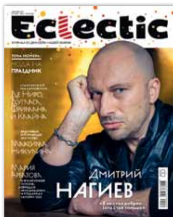
На обложке: Дмитрий Нагиев