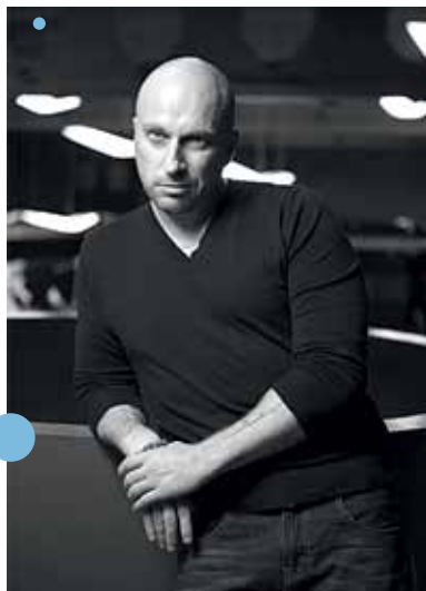
Творец без короны Недурно шутящий Дмитрий Нагиев