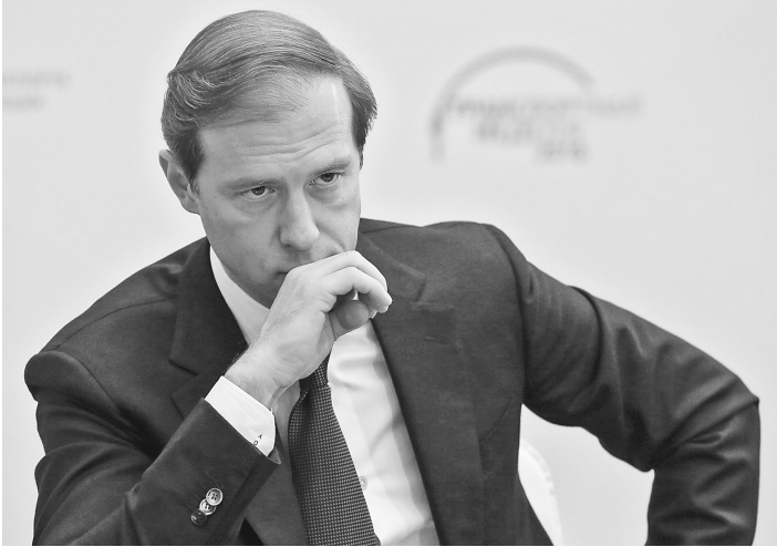
Денис Мантуров: Российские верфи построят 200 промысловых судов.

деньги Интерпол передал Банку России подготовленную к продаже базу платежных карт российских банков