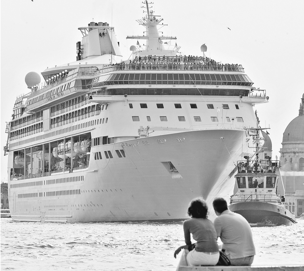
Российские круизные лайнеры ни в чем не будут уступать иностранным судам.

Минпромторг разработал «судовой утилизационный грант» в форме субсидий организациям на возмещение части затрат на приобретение или строительство новых гражданских судов взамен судов, сданных в утиль. В этом году на субсидии запланировано до 400 миллионов рублей. Финансирование