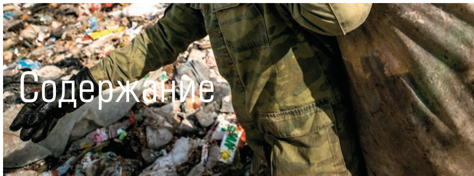
ОБЛОЖКА: КИРИЛЛ РУБЦОВ.