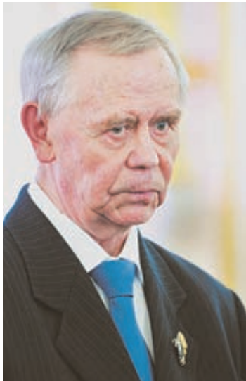
Валентин Распутин на торжественной церемонии в Кремле.

Может быть, название главной сегодняшней, особняком стоящей Государственной премии и ее статус еще по-настоящему не определились. «Достижения в области гуманитарной деятельности» – не так много говорят нашему сердцу. Но едва было произнесено имя лауреата, как мы поняли, что имели в виду ее организаторы. Валентин Григорьевич Распутин (а это был он) по протоколу стал последним из чествуемых, но стена аплодисментов тотчас отделила его от остальных награжденных. Государственные протоколы, очевидно, не предполагают общего вставания, но тут было отчетливо ясно, что Георгиевский зал Московского Кремля встал. И это свидетельствовало не только о высоте дарования и вклада в отечественную культуру, но и о том, чего ждет общество, какие ценности оно считает на этот час самыми насущными. Можно и должно восславить каждого лауреата (каждое имя – гордость Отечества), но есть что-то общее, что разом объединяет людей независимо от области знания и служения. А в зале были ученые и политики, министры и депутаты, художники и хозяйственники, и стена аплодис-