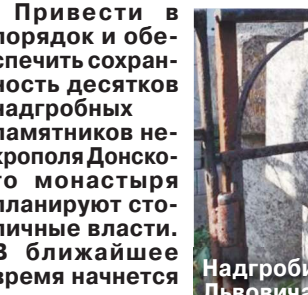
Надгробие Василия Львовича Пушкина.