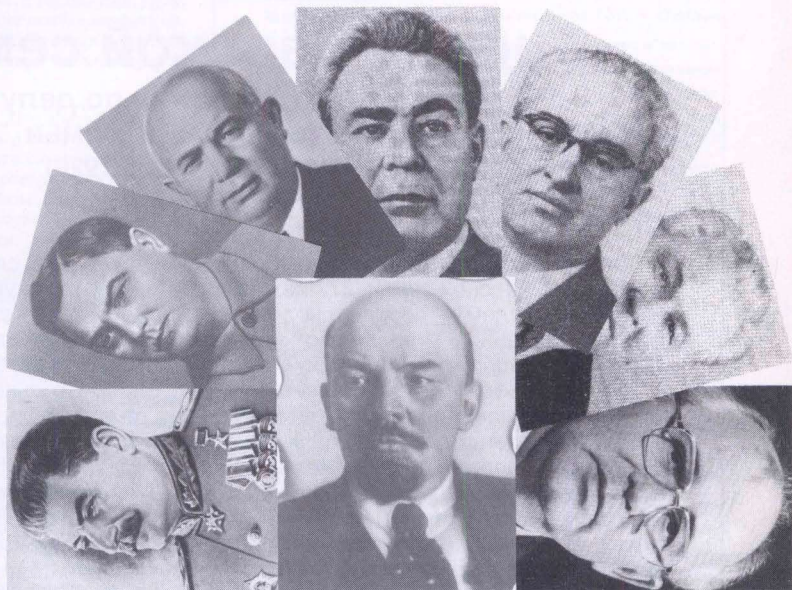
Слева направо: И. В. Сталин, Г. М. Маленков, Н. С. Хрущев, Л. И. Брежнев, Ю. В. Андропов, К. У. Черненко, М. С. Горбачев.