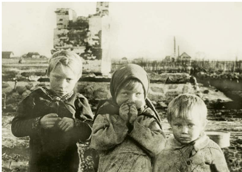
Советские дети, лишённые оккупантами своих домов