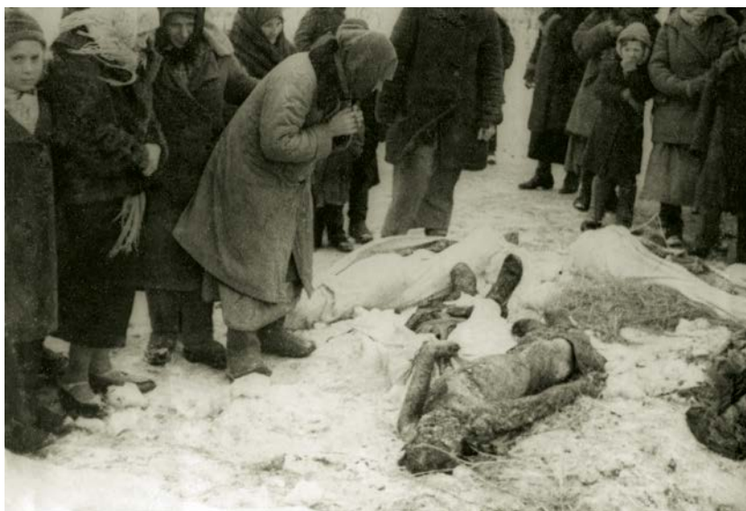
Зверства фашистов на оккупированной земле