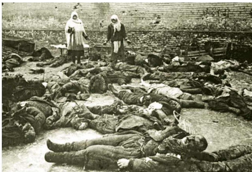
Трупы расстрелянных немцами мирных жителей