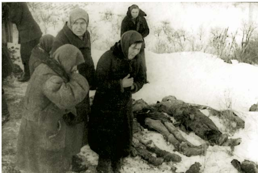
Женщины оплакивают убитых карателями односельчан