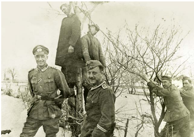
Немецкие офицеры, позирующие перед фотоаппаратом на фоне казнённых советских солдат