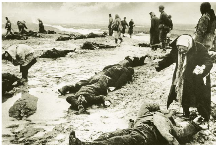
Результаты карательной акции