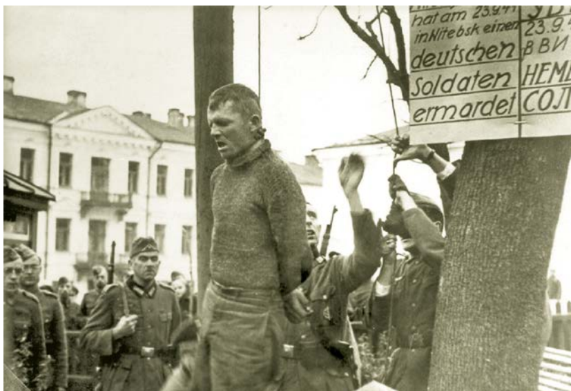
Сцена казни советского патриота