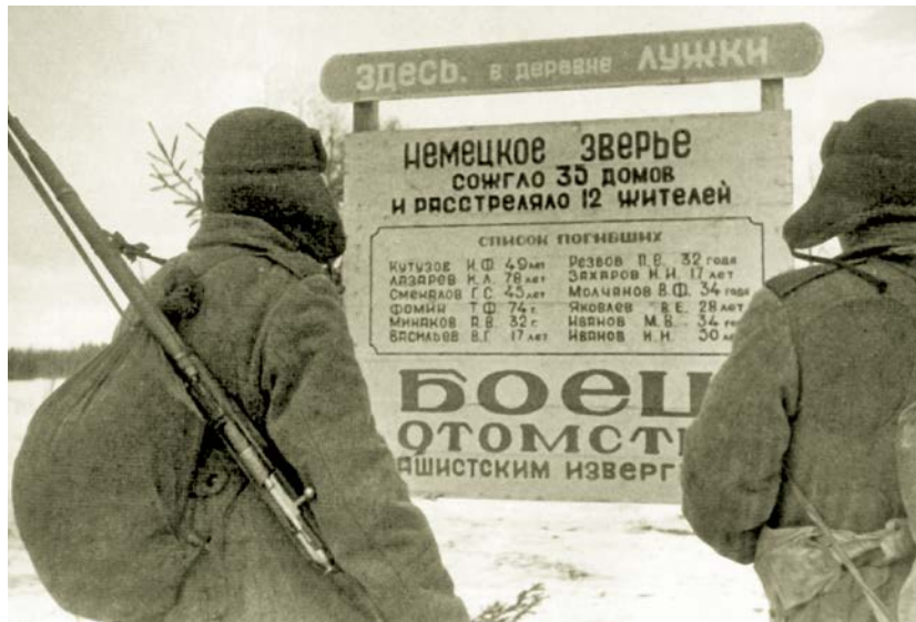
Советский агитационный стенд, демонстрирующий зверства фашистов