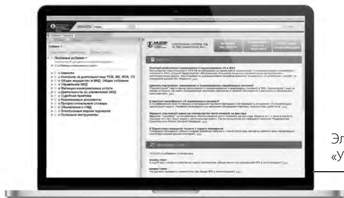
Электронная система «Управление многоквартирным домом»

Ведущее ежемесячное издание для специалистов отрасли ЖКХ Издается с 1998 года Выходит в 2 частях