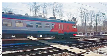
КАДР С ВИДЕО

Жуткая трагедия произошла в воскресенье вечером на пешеходном переходе через железную дорогу в подмосковном Королеве. У 14-летнего школьника застрял в настиле велосипед, и пока он мешал, пытаясь вытащить свой транспорт, подростка сбила электричка.