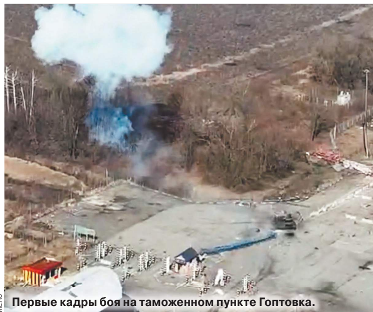
Первые кадры боя на таможенном пункте Гоптовка.