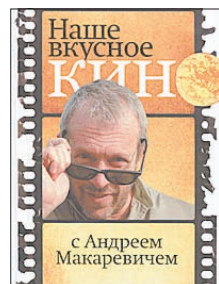
Макаревич А. Наше вкусное кино с Андреем Макаревичем. М.: КоЛибри, Азбука-Аттикус, 2011. — 208 с.: ил.

7 «Федя! Дичь!!!», «Мусик! Ну готов гусик?» , «Икра заморская, баклажанная!», «Какая гадость эта ваша заливная рыба!» Все мы помним и любим эти гастрономические перлы советского кино, но много ли мы знаем о правильном приготовлении этого самого гусика? Андрей Макаревич, как всегда, готов поделиться ценным кулинарным опытом.