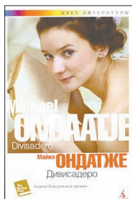
Ондатже М. Дивисадеро: Роман / Пер. с англ. А.Сафронова. СПб.: Азбука, Азбука-Аттикус, 2011. — 288 с. — (Цвет литературы).

4 Сначала речь идет о семье, что в 1970-х годах живет на ферме в Калифорнии, потом о старой французской усадьбе, а когда события Первой мировой переключаются с телерепортажами о войне в Персидском заливе и карточный шулер напоминает цыгана-гитариста с другой стороны Атлантики, — вы понимаете, что все истории Ондатже сохраняют друг с другом связь.