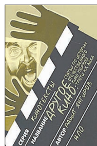
Янгиров Р. Другое кино. Статьи по истории отечественного кино первой трети XX века. М.: Новое литературное обозрение, 2011. — 414 с.

5 Каким был кинематограф до революции? Как снимали Николая I и Ленина? Как подавались на экране религиозные сюжеты или еврейская тема, и что стало с мастерами той эпохи в советском кино? На эти и многие другие еще малоизученные темы рассуждает Рашид Янгиров — историк отечественного кино.