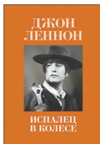
Леннон Дж. Испанец в колесе / Пер. с англ. А.Курбановского. М.: Манн, Иванов и Фербер, 2011. — 208 с.

6 Он не только был певцом и композитором — тем, чье имя в первую очередь называешь, когда слышишь слово «Beatles». Джон Леннон был писателем. Вы читали его сборник миниатюр «Пишу как пишется»? Первая книга была смешной, эта — саркастична: 1960-е годы, литературные традиции и шаблоны, интеллектуалы и циники — колючий английский юмор.