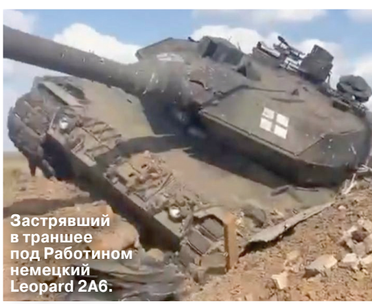
Застывший в траншее под Работином немецкий Leopard 2A6.