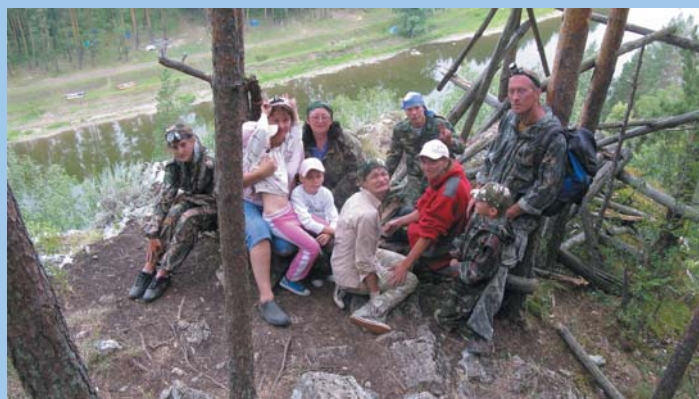
Дети с нами