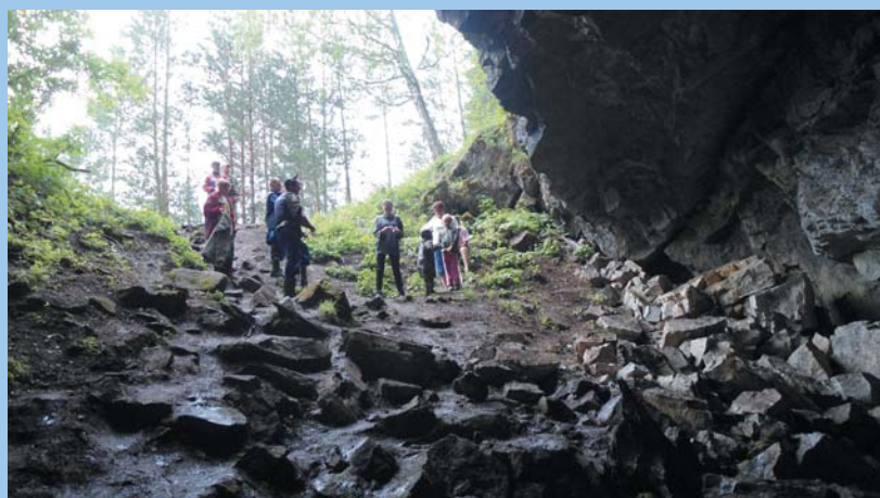
В этой пещере всем места хватит