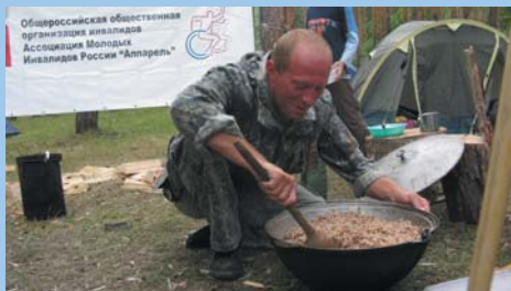
Пищи хватит на всех