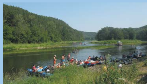
Наша команда на р. Ай