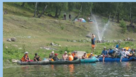
Фонтан у реки