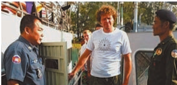
Сергей Полонский закончил праздновать в камбоджийской тюрьме.

40-летний Полонский – персонаж действительно экзотический, поэтому неудивительно, что он умудрился попасть в такую трагикомическую историю. Известно, что Сергей Юрьевич очень увлекается восточными духовными практиками, пытался слетать в космос в качестве туриста, прославился в СМИ крылатой фразой о том, что те, кто не имеет миллиарда, могут идти по известному в народе адресу. Одним словом, оригинал, хотя и типичный представитель русского нуворишества, которое не устает удивлять мир скандальными выходами – вспомнить только знаменитые