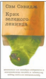
Сэвидж С. Крик зеленого ленивца / Пер. с англ. Е.Суриц. М.: Иностранка, Азбука-Аттикус, 2011. – 288 с.

2 После того, как Сэм Сэвидж сделал главным героем крысу, от него можно было ждать чего угодно. Однако второй роман американца, несмотря на название, — не про животное. В центре внимания — человек, но какой! Энди Уиттакер — основатель и издатель журнала «Мыло», пишет письма, из которых писатель сооружает книгу.