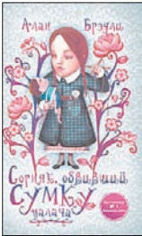
Бредли А. Сорняк, обвивший сумку палача / Пер. с англ. Е.Измайловой. М.: АСТ, Астрель, Харвест, 2011. – 416 с.

3 Продолжение приключений Флавиус де Люс. Расследование смерти заезжего кукольника открывает мрачные тайны, о которых уже давно никто не вспоминал. Несколько лет назад в лесу обнаружили повешенного мальчика, полиция так и не смогла выяснить, несчастный случай это или убийство. Каково же было удивление, когда в театральной постановке личико куклы оказалось копией погибшего Робина!