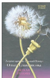
Славникова О. Легкая голова. М.: АСТ, Астрель, 2011. — 416 с.