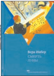
Инбер В. Смерть луны: Рассказы. М.: Текст: Книжники, 2011. – 157 с.

1 В этот сборник вошли рассказы, которые поэтесса Вера Инбер (1890–1972) писала в 1920–30-е годы. О смене времен года и о перемене настроений, о Москве и ее жителях, с зонтиками и тросточками, в шляпах и котелках, калошах и френчах — таких разных и похожих, друг на друга — и на нас сегодняшних.