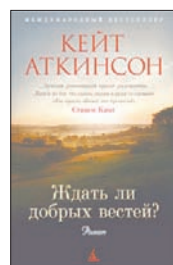
Аткинсон К. Ждать ли добрых вестей? / Пер. с англ. А.Грызуновой. СПб.: Азбука, Азбука-Аттикус, 2011. — 384 с.