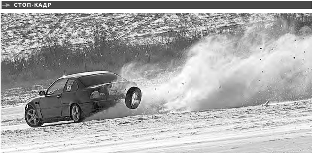
В Астрахани устроили ледовую битву—соревнования по трековым автогонкам на льду. Этап чемпионата области проходил на замерзшем ильмене недалеко от села Солянка. Скорость, необычные трюки, виртуозное вождение автомобиля—заораживающее зрелище и масса эмоций.

ПРОБЛЕМА обманутых дольщиков в республике является одной из самых актуальных и острых. Правительство Калмыкии разработало порядок предоставления финансовых средств дольщикам, жилищно-строительным кооперативам, организованным дольщиками, а также застройщикам. В этом году будет завершено строительство дома № 52 в 9-м микрорайоне Элисты, а два дома № 50 в первом и девятом микрорайонах будут заселены в следующем году.