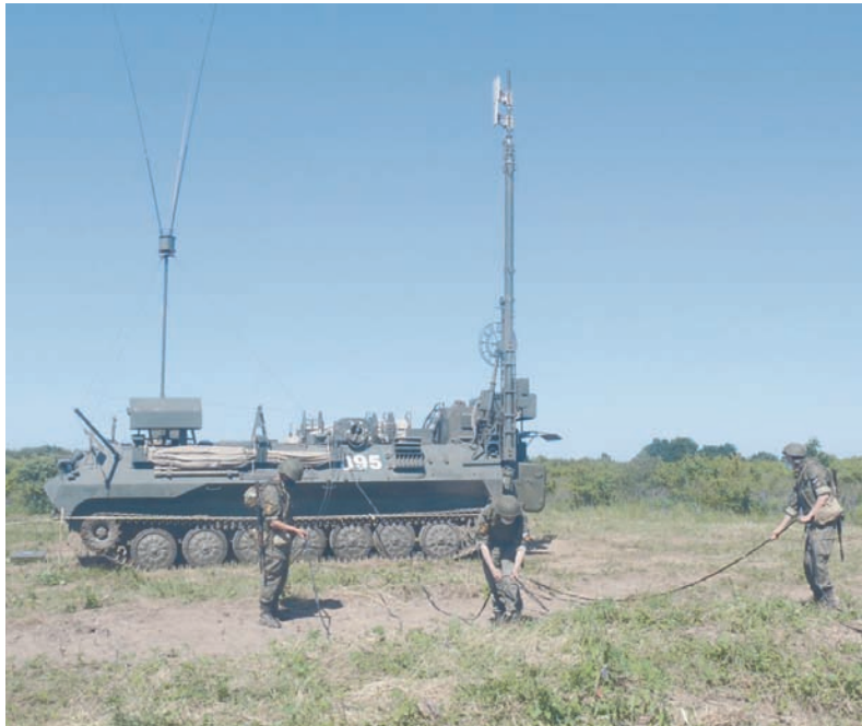
Развернулись на незнакомой местности.