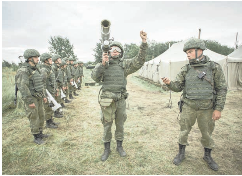
Боевая учёба на полигоне.

Владимир ДАШЕВСКИЙ, фото автора и Ю. Дмитриева.